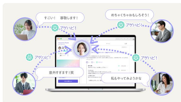
「Happiness Planet Connect」のイメージ図