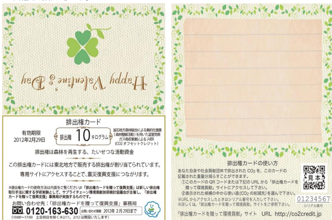
1: 実験で使用するカード (左=外面、右=中面)

なお、排出権は環境省により管理されている3つのCO 2 削減・吸収プロジェクトによるJ-VERを利用します。(1) 岩手県県有林における森林吸収量取引プロジェクト(岩手県)、(2) 釜石市緑のシステム創造事業(岩手県釜石市)、(3) 三田農林株式会社 間伐促進型プロジェクト(岩手県盛岡市)を利用します。