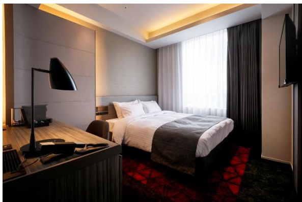
<モデルートクイーン／21 m 2 >