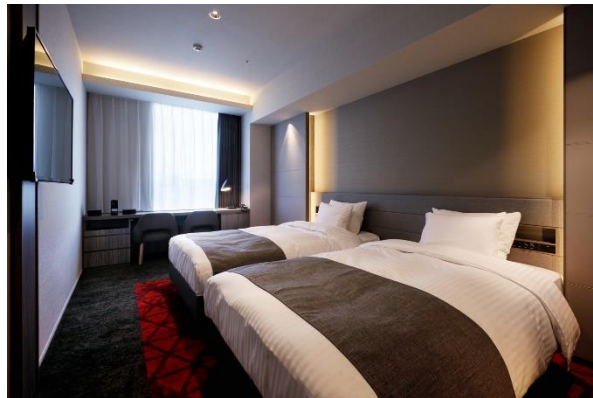
<スーペリアツイン／28 m 2 >