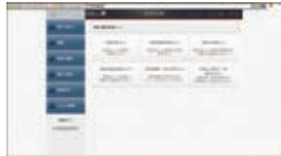
「e-Leasing Direct Platinum」画面イメージ