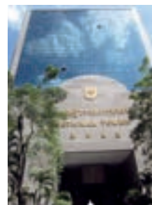
ユーマシン（タイ）が入居するオフィスビル

中古工作機械・産業機械の仕入販売を行うグループ会社のユーマシンがタイに営業拠点を開設、事業を開始しました。国内外のネットワークを活用して、お客様に中古機器の売買情報を提供しています。