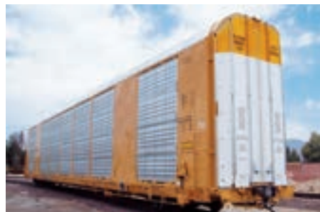
北米で運行されている貨車（例）