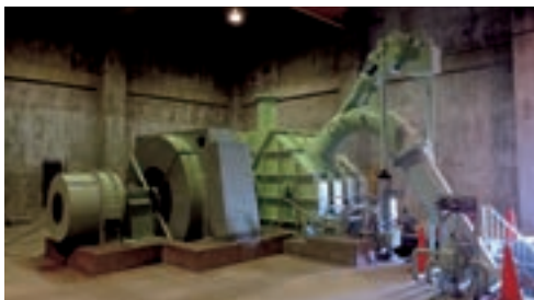
水力発電設備（山形県山形市）

発 電 事 業 者：株式会社山形発電 ESCO事業者：三菱UFJリース株式会社 日本ファシリティ・ソリューション株式会社 山銀リース株式会社 対 象 設 備：水力発電設備（出力1,374kW） 事 業 期 間：23年間 事 業 開 始：2017年4月予定