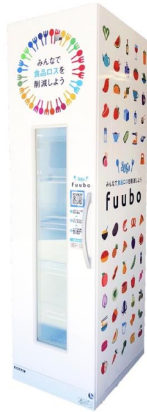
フードロス削減ボックス fuubo