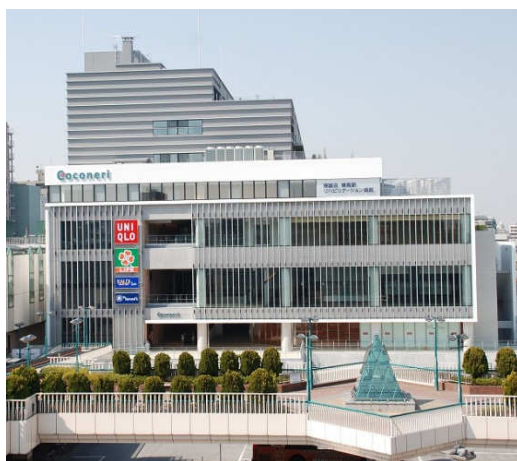
「Coconeri (ココネリ)」施設外観

当社は、2014年4月11日に、東京都練馬区の区有地を活用した区施設と民間施設からなる官民複合施設「Coconeri (ココネリ)」をオープンいたしますので、お知らせいたします。